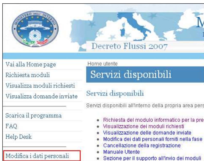
Accesso alla procedura di modifica dei dati personali

In qualsiasi momento è possibile apportare modifiche ad alcuni dei dati personali, ad esempio la password, forniti in fase di registrazione. Per accedere alla funzionalità, utilizzare il link "Modifica i dati personali" disponibile all'interno del menù di navigazione posto sulla parte sinistra della pagina.