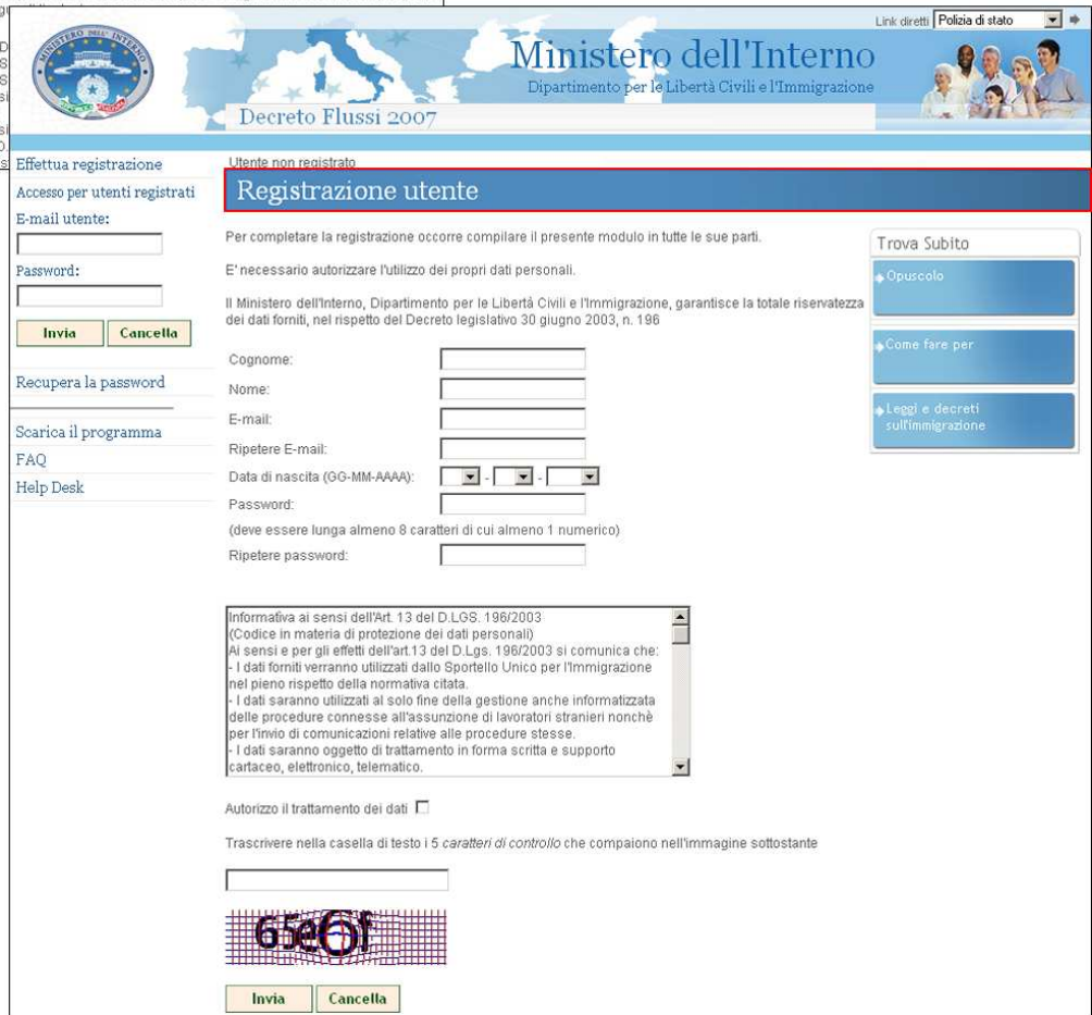
Il modulo di registrazione da compilare