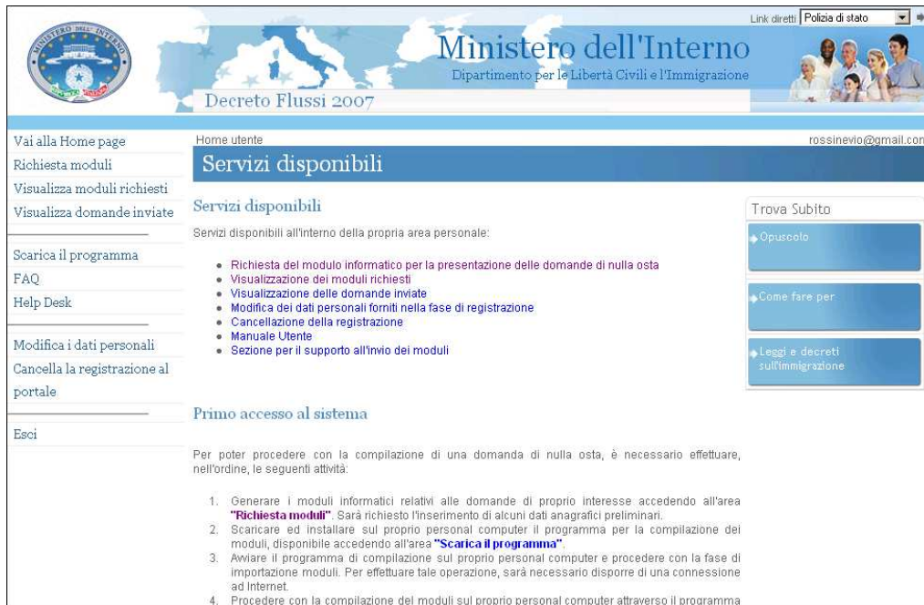
Pagina personale utente